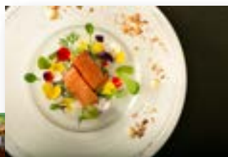
フランス料理エスカール

【 Assorted appetizer 】 ノルウェーサーモンとイクラのダブル 白醬油・釜山菜・アボカドのタルタル 【 Soup 】 旬菜のスープ 【 Fish 】 仙台朝市仕入れ 鮮魚のマルセイユ風 石巻産アンチョビのアクセント 【 Meat 】 国産牛フィレ肉と登米産原木椎茸のロティール トリュフ&シャンピニオンソース 【 Dessert 】 エスカール特製デザート盛り合わせ 【 Bread 】 パン~ホテルメイドのオリブソースと共に召し上がりください~ 【 Coffee 】 コーヒー