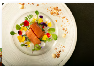
フランス料理エスカール